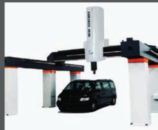
Máquinas de medición por coordenadas