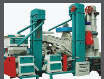
Equipos de proceso