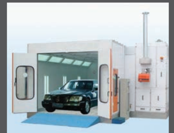
Talleres de pintura