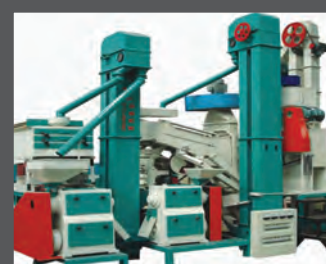
macchine di processo