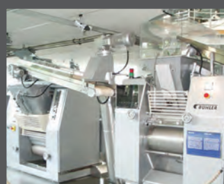
macchine per il confezionamento