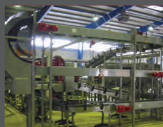
linee di produzione